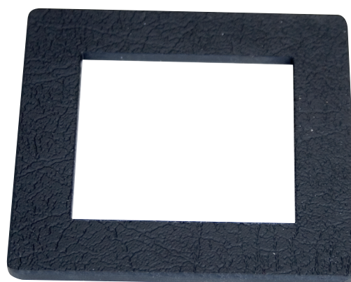
Panelram till manöverpanel (1151)

ALT. Som alternativ går naturligtvis hålet (49x51 mm) att sågas ut direkt - med rätt verktyg.